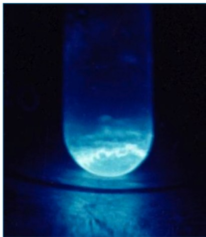
Figura 1. Fotografía de einstenio metálico luminiscente tomada de Wikipedia. [7] El reconocimiento debe hacerse a Richard G. Haire, US Department of Energy (ver referencia 1, p. 1580 donde aparece la fotografía)

El einstenio es un metal auto-luminiscente (Figura 1) y, aunque su radiactividad dificulta mucho la aplicación de las técnicas de difracción de rayos X, ya se ha determinado su estructura cristalina (red cúbica centrada en las caras), su radio atómico (2,03 Å) y su primera energía de ionización (6,3676 eV). [1] El tamaño atómico supone un brusco aumento en la serie de los actínidos, lo que se explica porque es el primero