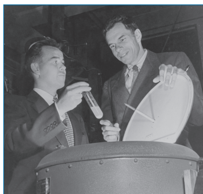
Figura 1. S. G. Thompson y G. T. Seaborg, © 2010 The Regents of the University of California, Lawrence Berkeley National Laboratory

El californio es el elemento más pesado de la tabla periódica que presenta aplicaciones fuera del ámbito de la investigación. Se produce anualmente en escala de miligramos (hasta 500 mg) mediante irradiación de curio con neutrones en reactores nucleares especiales (en el Oak Ridge National Laboratory en EE. UU. y en el Research Institute of Atomic Reactors en Rusia), obteniéndose 252 Cf como isótopo mayoritario. Aprovechando su excelente capacidad como emisor de neutrones, se han desarrollado diversas aplicaciones. [3] Así, se emplea en radiografía neutrónica para la detección de corrosión, fatiga