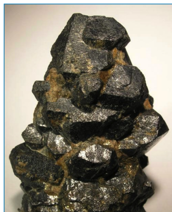
Figura 1. Imagen de uraninita [5]

nucleares, lo cual dio lugar a la fabricación de las bombas nucleares de Hiroshima y Nagasaki en 1945. Se basaban en uranio enriquecido y en plutonio (derivado de uranio). También se suele usar el uranio como estabilizador en aviones, como blindaje frente a radiaciones penetrantes, y en carros de combate como uranio empobrecido, el cual tiene una proporción de 235 U inferior a la del uranio natural.