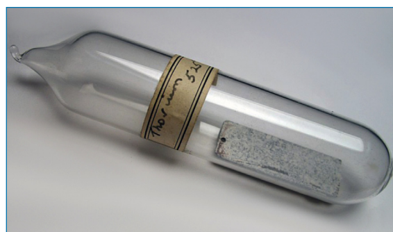
Figura 1. Metal torio mostrando signos de corrosión

La presencia de 230 Th en la serie del 238 U ha permitido que este elemento sea utilizado en técnicas de datación absoluta. La datación uranio-torio se ha llevado a cabo en materiales de 11 cuevas españolas que presentan evidencias de haber sido habitadas en el Paleolítico como por ejemplo, en las magníficas pinturas de la cueva de Altamira (Cantabria). [5]