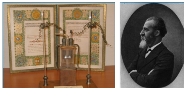
Figura 2. Celda electroquímica usada por Moissan y diploma del premio Nobel (izda.) Henri Moissan (dcha.)

La introducción de un átomo de flúor o un grupo fluorado en un fármaco aumenta, en general, su biocompatibilidad y su estabilidad metabólica. Es por ello que hoy en día prácticamente en todos los programas de desarrollo de un fármaco nuevo se estudian candidatos fluorados. [4] Por otro lado, el flúor-19 es un núcleo atractivo en espectroscopía de resonancia magnética nuclear ( 19 F-RMN) dado que presenta un espín nuclear de ½ y elevada sensibilidad en RMN. In vivo se utiliza para identificar y cuantificar los niveles de algunos metabolitos fluorados en tejidos vivos. [4] Además, durante las últimas dos décadas se ha desarrollado el uso del marcaje con flúor-18. El flúor-18 posee propiedades importantes como emisor de positrones, radionúcleos utilizados por ejemplo, en la preparación de radiosondas para la tomografía por emisión de positrones (PET). El PET es una poderosa técnica para la obtención de imágenes-3D in vivo con aplicaciones médicas. [4]