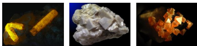
Figura 1. Minerales de flúor, de izquierda a derecha: fluorapatita, criolita y fluorita

El tratamiento de la fluorita con ácido sulfúrico produce ácido fluorhídrico a partir del cual se preparan fluoruros de valencia alta (CoF 3 , AlF 3 y otros) para perfluoración. Además, se han desarrollado métodos basados en el uso de ácido fluorhídrico para la preparación de compuestos organofluorados. [2] Existen más de 600.000 compuestos que contienen por lo menos un átomo de flúor y la química de los compuestos organofluorados ha supuesto un gran avance en diversos campos como son la química orgánica, ciencia de materiales, polímeros, farmacología y medicina. [3] Cabe señalar como ejemplos los clorofluorocarbonos usados en el pasado como