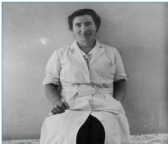
Figura 1. Marguerite Perey en 1938, un año antes del aislamiento del catium [2]

El francio debe su nombre al país galo, dada la nacionalidad de quien logró aislarlo e identificarlo en 1939: la física Marguerite Perey (1909-1975). Correspondiente al eka-cesio ( eka-caesium ) propuesto por Dimitri I. Mendeleiev (1834-1907), la historia del más pesado de los alcalinos refleja la naturaleza colectiva y controvertida del descubrimiento de un nuevo elemento químico. Una historia patente cuando se consideran los distintos nombres empleados para designar al elemento 87 a lo largo de las décadas de 1920 y 1930: rusio ( russium ), por el químico ruso Dimitri K. Dobroserdov (1876-1936) que realizó estudios teóricos sobre sus propiedades; alcalinio ( alkalinium ), por los químicos ingleses Gerald J. F. Druce (1894-1950) y Frederick H. Loring que anunciaron el descubrimiento del más pesado de los alcalinos a partir del análisis por rayos X de una muestra de sulfato de manganeso; virginio ( virginium ), en honor al