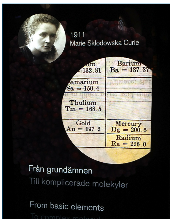
Figura 1. Imagen de Marie Curie, premio Nobel de Química en 1911, en el Museo Nobel de Estocolmo

En 1934 se demostró que, cuando el bismuto natural ( 209 Bi) es bombardeado con neutrones, se forma 210 Bi, que se transforma mediante una desintegración beta en 210 Po.