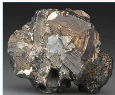
Figura 2. Bismuto nativo [https://bit.ly/2EWAm9, visitada el 08/03/2019]

forma cristales romboédricos que ocupan más volumen que el metal fundido. Esa propiedad, combinada con un bajo punto de fusión, hacen al Bi y a sus aleaciones materiales aptos para la soldadura. Su química es poco llamativa. Con potencial estándar de reducción Bi 3+ /Bi de 0,308 V, resiste bien la oxidación en condiciones ambientales; pero caliente al rojo, reacciona con O 2 y con H 2 O para dar su óxido característico amarillo, Bi 2 O 3 , que no muestra carácter ácido ni se disuelve en álcalis.