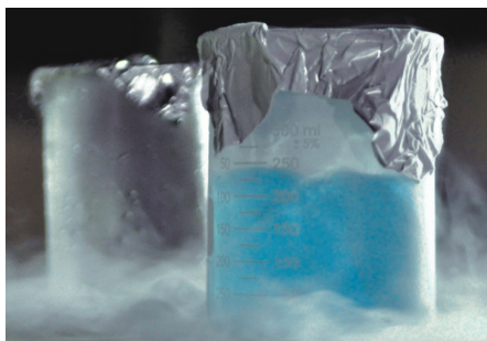
Figura 1. Oxígeno líquido en un vaso de precipitados (Consulta en: https://bit.ly/2RusrEZ , visitada el 1 de febrero de 2019)

El oxígeno elemental en forma de dióxígeno, O 2 , representa un 20,8 % en volumen de la atmósfera, por lo que suele obtenerse por destilación fraccionada del aire líquido. El O 2 en condiciones normales es un gas incoloro, pero en sus formas líquida y sólida es de color azul pálido (Figura 1).