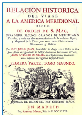
Figura 1. Retrato del Almirante Antonio de Ulloa, por Andrés Cortés (Patrimonium Hispalense. Ayuntamiento de Sevilla), y portada del libro donde alude a la platina