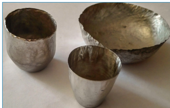
Figura 2. Crisoles y cápsula de Pt fotografiados por el profesor Adolfo Narros en la E.T.S. de Ingenieros Industriales (UPM)

El platino es un metal noble poco abundante en la corteza terrestre (~0,005 ppm), usado en joyería, electrónica (componente del disco duro de ordenadores), electricidad (termopares, termistores, condensadores...) y catalizadores. En esta última función, destaca su uso en procesos industriales, como la obtención de ácido nítrico a partir de amoníaco, y en el “catalizador” de automóviles (donde se destina casi la mitad de las ~220 toneladas anuales que se obtienen del metal), [5] que acelera la conversión de NO x , CO e hidrocarburos no quemados en N 2 , CO 2 y H 2 O. También se ha empleado para material de laboratorio químico (Figura 2), por su carácter inerte, [3] pero hoy solo de forma puntual por su elevado precio.