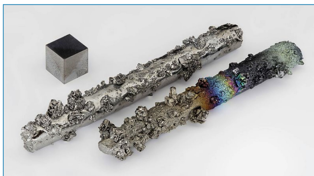
Figura 1. Varillas de wolframio con cristales evaporados, parcialmente oxidadas (pureza 99,98 %) y cubo de wolframio de 1 cm 3 de alta pureza (99,999 %) para su comparación [3]

fabricación de filamentos para lámparas eléctricas (ahora en desuso), tubos de vacío y de rayos X y en la técnica de evaporación de metales. Se ha utilizado para falsificar lingotes y joyas de oro por la semejanza de la densidad de ambos metales. Se emplea en bobinas y otros elementos de calefacción de hornos eléctricos que requieren trabajar a altas temperaturas y ser resistentes a la corrosión. Se utiliza en la industria militar, aeroespacial (motores y cohetes) y en catálisis.