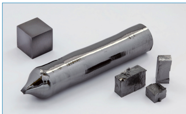
Figura 1. Cristal de tántalo de elevada pureza (99,999 %) preparado mediante el método de zona flotante, fragmentos cristalinos y cubo de 1 cm 3 (99,99 % = 4N) para su comparación [5]

La química del tántalo es sobre todo la del estado de oxidación +5, la reducción a estados de oxidación inferiores es difícil y da lugar a compuestos que, salvo en el caso de los clústeres, son inestables. Por otra parte, los deriva-