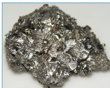
Figura 1. Hafnio electrolítico (muestra de unos 3 cm de largo) [4]

circonio [Zr(η 5 -Cp) 3 (η 1 -Cp)]. Por su tamaño, el metal puede mostrar números de coordinación desde 4, por ejemplo con ligandos amiduro voluminosos, mayores de 6 con ligandos duros (O y N-dadores o F - ), o hasta 12 como formalmente se asigna en los complejos con ligandos tetrahidruoborato [M{(μ-H) 3 BH 4 }] (M = Zr, Hf).