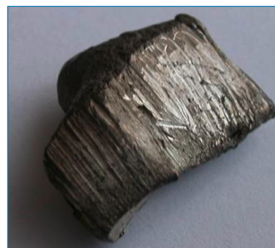
Figura 1. Iterbio metálico [2]

El iterbio puede llegar al medio ambiente por los vertidos de industrias petroquímicas o por electrodomésticos en desuso. Se puede acumular gradualmente en los suelos y contaminar sus aguas, lo que puede incrementar su concentración en los seres humanos y otros animales, hasta provocar daños en las membranas celulares y afectar al sistema nervioso central. [4]