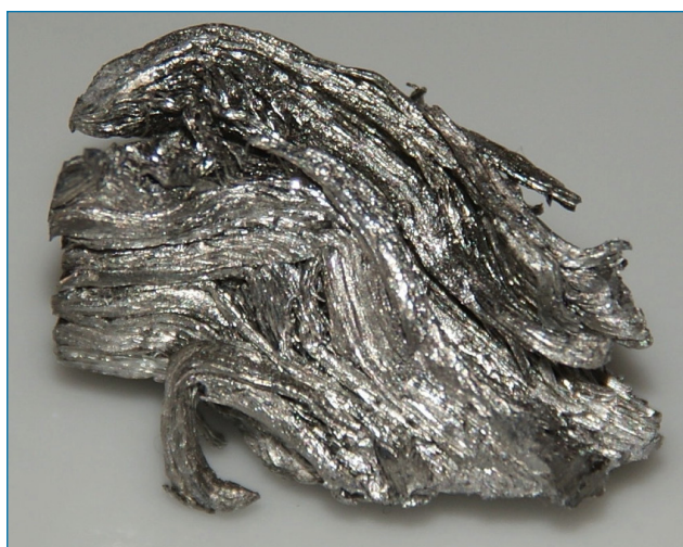
Figura 1. Holmio metal

Sólo tiene un isótopo estable, el holmio-165, pero se conocen 30 isótopos radiactivos sintéticos con masas ente 141 y 172, siendo el holmio-163 el de mayor vida media con 4570 años.