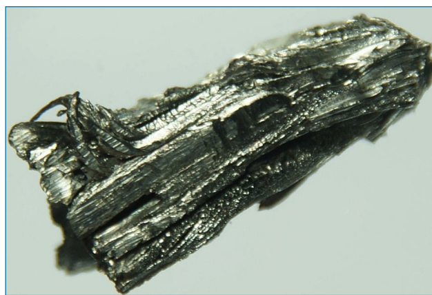
Figura 1. Disprosio dendrítico ultrapurificado [4]

Entre las aplicaciones del disprosio se puede destacar su uso en la aleación Terfenol-D, de fórmula Tb x Dy 1-x Fe 2 (donde x es aproximadamente 0,3). Es un material magnetostrictivo, que cambia de forma reversiblemente al aplicarle un campo magnético. El Terfenol-D tiene aplicaciones en los sistemas de sonar de los barcos y en todo tipo de sensores y transductores. Asimismo, junto con un poco de yoduro de cesio y bromuro de mercurio(II), el yoduro de disprosio(III) se utiliza en las lámparas conocidas como MSR ( Medium Source Rare Earth Lamps , o lámparas de tierras raras de fuente media). Estas son lámparas de descarga donde el yoduro de disprosio(III) emite en un amplio rango de frecuencias. Al igual que otros lantánidos más pesados, el disprosio tiene un elevado número de electrones desapareados, lo que le da al metal y a sus iones una alta susceptibilidad magnética. Por ello, ha crecido su empleo en dispositivos de almacenamiento de datos. Otra característica del disprosio es su alta sección eficaz de absorción de neutrones térmicos. Por ello, se utiliza para fabricar las barras de control que se colocan en los reactores nucleares para absorber el exceso de neutrones en las reacciones de fisión.