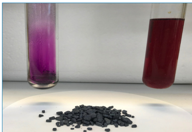
Figura 1. Yodo: vapor característico, yodo cristalino y solución de yodo en diclorometano.

El yodo es el más pesado entre los halógenos estables y el único que es sólido a temperatura ambiente. Se sublima fácilmente para generar un particular gas púrpura (Figura 1). Por sí mismo, tiene características de un metal, pero reacciona fácilmente con la mayoría de los otros elementos dando lugar a los correspondientes yoduros. El yodo da lugar a una rica familia de compuestos siendo capaz de aparecer en los estados de oxidación -1, 0, +1, +3, +5, +6 y +7. [2,4] Un valioso reactivo de yodo(I) fue inventado en España y se conoce como reactivo de Barluenga . [5] Recientemente, los derivados polivalentes de yodo(III) y yodo(V) han suscitado aplicaciones novedosas en la química orgánica sintética. Como resultado, los compuestos de yodo son considerados como una importante clase de oxidantes sostenibles,