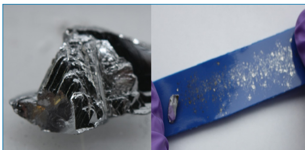
Figura 1. Imagen de un cristal de antimonio (izda.) y un paso del proceso de exfoliación micromecánica que condujo al aislamiento del alótropo denominado “antimoneno” (dcha). [4]

Como se observa en la Figura 1, el antimonio presenta brillo metálico y apariencia escamosa, de hecho, tiene una