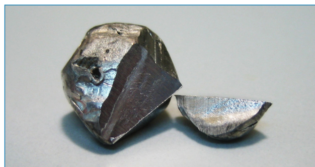
Figura 1. Pieza de indio recién cortada. Se observan el brillo metálico y las marcas de los instrumentos empleados para el corte, indicativas de la ductilidad del metal

res los compuestos con enlace In–In y los clústeres de indio. La combinación de indio con elementos del grupo 15 conduce a materiales semiconductores que se emplean en fibras ópticas y LEDs. [3] En el campo de la química orgánica el indio ha despertado gran interés desde finales del siglo xx, cuando se desarrollaron las reacciones de alilación de compuestos carbonílicos con In 0 , que pueden realizarse en medio acuoso debido a la estabilidad del metal en este medio. Posteriormente, se empleó en otros procesos, como reacciones de reducción y radicalarias. El In + tiene pocas aplicaciones debido a su fácil oxidación. Sin embargo, las sales de In 3+ se utilizan como ácidos de Lewis en procesos de activación \sigma y, más recientemente, en la activación de especies insaturadas (activación \pi ). [4] La química organometálica del indio está asociada a procesos de alilación y similares, así como en la aplicación de los organometálicos de indio(III) en reacciones catalizadas por metales de transición, un campo donde este metal se ha mostrado como una herramienta útil y versátil. [5]