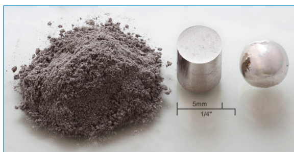
Figura 1. Un gramo del elemento químico rodio en diversas formas: polvo, cilindro obtenido por presión, bola refundida obtenida bajo argón usando un arco eléctrico.

El rodio es un metal de color blanco plateado (Figura 1), dúctil y duro, que cristaliza en una red cúbica centrada en las caras. Incluso pulverizado finamente, se disuelve muy lentamente en agua regia o ácido sulfúrico concentrado (se disuelve mejor en una mezcla de HCl y NaClO 3 en caliente). El máximo estado de oxidación alcanzable es el +6, i. e. RhF 6 , pero los estados de oxidación superiores a +3 son oxidantes fuertes. Mientras que el estado de oxidación +2 es el más estable para cobalto en agua, Rh(III) es mucho más estable que Rh(II), que es un reductor fuerte. La importante química de coordinación de Rh(I) está casi enteramente dominada por ligandos aceptores \pi .