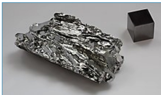
Figura 1. Fragmento macrocristalino de molibdeno (pureza 99,99 %) junto a un cubo monocristal de 1 cm 3 de molibdeno de alta pureza (99,999 %) [1]

Hoy en día, la mayor parte del molibdeno se obtiene de la molibdenita, de la wulfenita (PbMoO 4 ), de la powelita (CaMoO 4 ) o como subproducto de la extracción y el procesamiento del wolframio y del cobre. Los principales productores de molibdeno son: China (más del 40 %), Estados Unidos, Chile, Perú y México. La mayor parte de la producción mundial de este elemento se utiliza en aleaciones de uso industrial para endurecerlas o para hacerlas más resistentes a la corrosión: aceros inoxidable, aceros para herramientas, aleaciones de alta resistencia a la corrosión y superaleaciones de alta temperatura con concentraciones