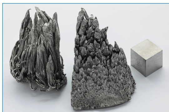
Figura 1. Dos muestras de itrio dendrítico sublimado y cubo de itrio de 1 cm 3 de alta pureza [3]

Se encuentra especialmente en minerales de tierras raras y se suele preparar comercialmente de manera similar a como lo hizo Wöhler en el siglo XIX, por reducción metalotérmica de YCl 3 con calcio. Es un metal de color plateado, relativamente estable al aire, aunque arde a temperaturas superiores a 600 °C (en forma de virutas puede arder espontáneamente a temperatura ambiente) (Figura 1). Su química presenta muchas similitudes con la observada para el resto de los lan-