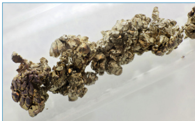
Figura 1. Cristales sintéticos de estroncio sumergidos en argón en una ampolla de vidrio (pureza de 99,95 %) [bit.ly/2TT89Kz], visitada el 24/01/2019

El Sr es muy abundante en la corteza terrestre, pero al ser muy reactivo no se encuentra en estado metálico elemental sino combinado con otros elementos en rocas y minerales. Hoy en día, se obtiene principalmente a partir del mineral celestina (SrSO 4 ), siendo China, España y México los principales países productores. [4]