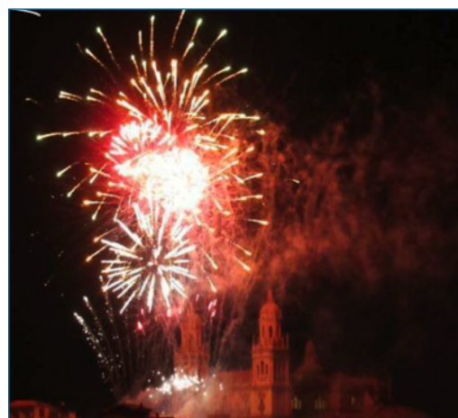
Figura 2. El color rojo de los espectáculos pirotécnicos se debe a los nitratos y cloratos de estroncio. (Fotografía realizada por Agustín Garzón el 15/12/2018, durante el espectáculo "Sueños en Navidad" en Jaén)

Inicialmente, los compuestos de estroncio encontraron utilidad durante décadas en el proceso de refinado del azúcar de caña y luego, protegiéndolos de radiaciones dañinas en los tubos de rayos catódicos de televisores y ordenadores. Actualmente, las aplicaciones de los compuestos de estroncio más importantes son la fabricación de ferritas magnéticas, la pirotecnia civil y militar (bengalas y fuegos artificiales) (Figura 2) y en pinturas anticorrosivas. En cantidades menores se emplea en la obtención de zinc de alta pureza, en la fabricación de vidrios, y en forma de titanato, estanato y zirconato, para aplicaciones electrónicas.