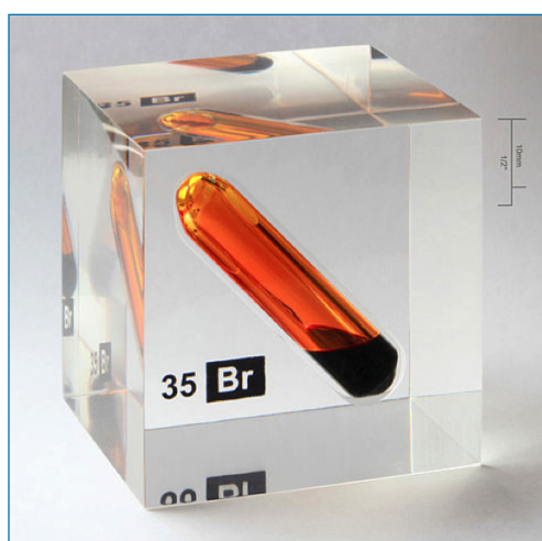
Figura 1. Vial de bromo líquido en equilibrio con su fase gas dentro de un recipiente de metacrilato [3]

La obtención del bromo implica la oxidación de los bromuros, su mena natural. Este proceso de obtención se puede realizar por las vías ordinarias: oxidación química en medio ácido (con MnO 2 , KMnO 4 ...) o bien por oxidación electroquímica. En la actualidad, se obtiene por oxidación de los bromuros con cloro, y el bromo líquido que se obtiene muy impuro, se destila fraccionadamente para obtenerlo como un líquido denso de color rojo parduzco (Figura 1). [3] El máximo productor de bromo en el mundo es Estados Unidos, cuyas salmueras de Arkansas contienen cerca de 5000 ppm y las de Míchigan poseen unas 2000 ppm. También es importante la producción del Mar Muerto, cuyas aguas tienen una concentración de cerca de 5000 ppm. El bromo se encuentra en todos los mares y lagunas