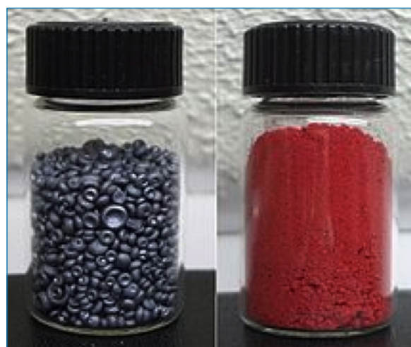
Figura 1. Izquierda: Muestra de alótropo de selenio negro, vítreo amorfo con una capa delgada de selenio gris; derecha: muestra de alótropo de selenio rojo amorfo en polvo ( https://bit.ly/2s3hSxG ), visitada el 07/03/2019)

La ingestión de selenio a través de la comida normalmente es suficiente para satisfacer las necesidades humanas, pero si hay déficit de selenio en el organismo puede haber problemas de corazón o musculares. Si hay exceso de selenio, según la cantidad en el cuerpo, pueden darse efectos tóxicos que abarcan desde sarpullidos, dolor agudo, calor o quemaduras hasta insuficiencia cardíaca o incluso la muerte. [4]