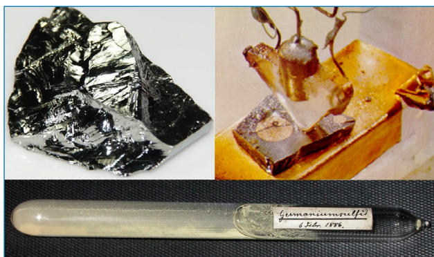
Figura 1. Primera precipitación de sulfuro de germanio (debajo), pedazo de germanio elemental (izquierda) y primer transistor fabricado por los Laboratorios Bell con un bloque de germanio policristalino ultra puro (derecha) [2]

El germanio \alpha , alótropo habitual en condiciones normales, es un semimetal de color blanco grisáceo lustroso y quebradizo que tiene la misma estructura que el diamante (Figura 1). Ocupa la posición seis en la escala de Mohs de dureza,