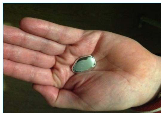
Figura 1. El galio se derrite en la mano

Los investigadores han descubierto la biocompatibilidad del nitruro de galio. Este descubrimiento podría conducir a electrodos más seguros y eficientes que estimulen las neuronas en el cerebro para tratar trastornos neurológicos como el Alzheimer. El isótopo radiactivo 67 Ga es utilizado en exploraciones mediante scanner para detectar tumores o infecciones en el cuerpo humano. [5] En el campo de la medicina, los compuestos de galio(III) tienen un importante efecto bactericida al competir con el hierro(III) en las cadenas metabólicas oxidativas de las bacterias.