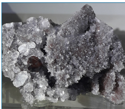
Figura 1. Esfalerita (con calcita y cuarzo). Procedencia: Mina Yaogangxian, China [6]

El zinc es un metal sólido bastante frágil a temperatura ambiente, de color gris azulado. Entre 100 - 150 °C es un metal blando y dúctil fácilmente maleable que puede ser transformado en cables o enrollado como finas láminas. A temperaturas superiores a 200 °C adquiere de nuevo un carácter quebradizo y puede pulverizarse con facilidad.