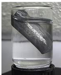
Figura 1. Litio metálico flotando en aceite [3]

Es uno de los elementos primordiales, se generó en el Big Bang junto con el H y el He. Sin embargo, su presencia en el Universo es inferior a lo esperado. Esto se atribuye a que su núcleo está en el borde de la inestabilidad, ya que sus dos isótopos estables tienen unas de las energías de enlace por nucleón más bajas de todos los nucleidos estables. [3]