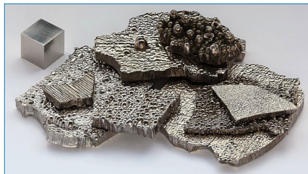
Figura 1. Algunos fragmentos de cobalto puro (99,9%) refinado por electrólisis, junto a un cubo de 1 cm 3 de cobalto de alta pureza (99,8% = 2N8) para comparar

El principal país productor y exportador de cobalto es la República Democrática del Congo, que posee los mayores yacimientos del mundo, seguido de Australia, Cuba, Filipinas, Zambia, Rusia y Canadá. [5]