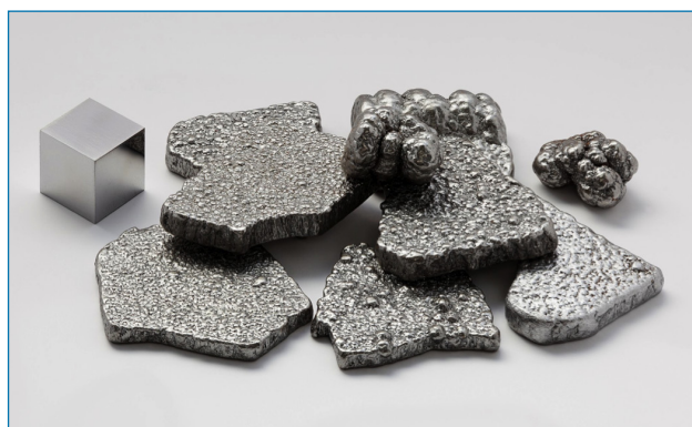
Figura 1. Hierro de alta pureza (más de 99,97 %) refinado electrolíticamente y un cubo de hierro de alta pureza de 1 cm de lado [4]

Además, el hierro es un elemento esencial para la vida. Se encuentra en prácticamente todos los organismos, lo cual se relaciona con su abundancia en la corteza terrestre y por lo tanto, con su disponibilidad durante la evolución. [5] La cantidad de hierro que contiene el cuerpo humano está alrededor de 4 gramos y se requiere de un aporte diario de entre 10 y 18 mg. Su deficiencia lleva al desarrollo de la anemia. La mayor parte de este hierro se localiza en el centro activo de proteínas con funciones claves para la vida. Por ello resulta un elemento fundamental en la estructura de la mioglobina, proteína encargada del almacenamiento de O 2 , y de la hemoglobina, proteína responsable del transporte de O 2 en la sangre dentro de los glóbulos rojos. Además, existen muchas otras enzimas involucradas en procesos de activación del oxígeno y en el transporte de electrones que también contienen hierro en su centro activo, como por ejemplo citocromo P450, citocromo c oxidasa, proteínas Fe-S, catalasas o peroxidases. [5] Algunos de estos sistemas biológicos sirven de inspiración para el desarrollo de catalizadores sintéticos.