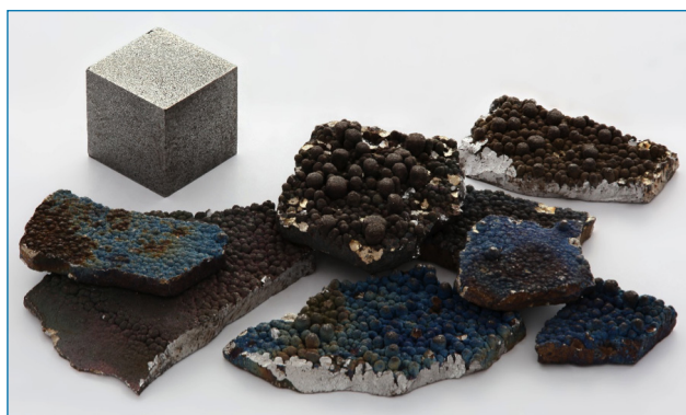
Figura 1. Fragmentos de Mn puro (99,99 %) refinado electrolíticamente, con el aspecto típico de una superficie oxidada por el aire, así como un cubo de 1 cm 3 de Mn de alta pureza (99,99 %), para comparar [https://bit.ly/2TEd7Le, visitada el 12/03/2019]

El manganeso metálico es un metal grisáceo muy frágil (Figura 1) y no se usa en estado puro, sino como aleaciones, especialmente en el acero, donde un 1 % de Mn mejora la dureza y resistencia. El acero de manganeso contiene 12-14 % de este metal, es extraordinariamente duro y resistente a la abrasión, y recibe usos especiales como en las vías del tren, cascos o la manufactura de rifles. Otros compuestos de manganeso de interés comercial son el dióxido, el sulfato y el permanganato de potasio; el primero se utiliza como catalizador y en baterías, el segundo en la manufactura del manganeso metálico y en la preparación de fungicidas, y el tercero es un oxidante común, que sirve para purificar gases y aguas residuales que contienen materia orgánica. Asimismo, el dióxido de manganeso es