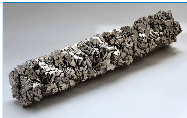
Figura 1. Barra de titanio de alta pureza (99,995 %) [5]

de golf y bicicletas), ordenadores portátiles, muletas y joyería. [2]