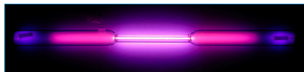
Figura 2. Tubo de descarga relleno de argón. https://pse-mendeleejew.de/argon/

Por otro lado, se ha sintetizado el fullereno endoédrico \text{Ar}@C_{60} , siendo el más estable de todos los preparados con gases nobles. [4]