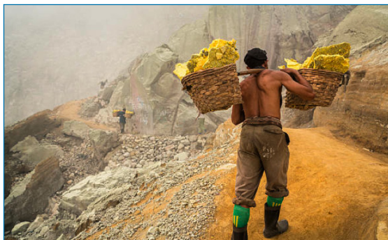
Figura 1. Minería a cielo abierto de azufre en el cráter del volcán Kawah Ijen, Java Oriental, Indonesia

Se conocen modificaciones alotrópicas del azufre debido tanto a las diferentes formas de unirse los átomos de azufre