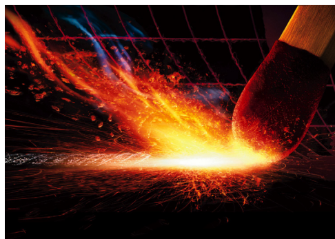
Figura 1. Uso de fósforo en la cabeza de una cerilla

La toxicidad e inflamabilidad espontánea del P 4 le confiere una característica bélica. Durante la Segunda Guerra Mundial su uso fue masivo. [1] La investigación realizada an-