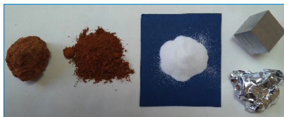
Figura 1. De izquierda a derecha: Bauxita original y molida, alúmina (blanca), y Al (cubo de 2,5 cm de lado y muestra de “papel” de aluminio). Fotografía tomada por G. Pinto de muestras donadas por el Grupo Alcoa España en 2010 a la E.T.S. Ingenieros Industriales (Universidad Politécnica de Madrid)

con magnesio, se denomina “mezcla termita” y se usa, por ejemplo, para soldar carriles ferroviarios.