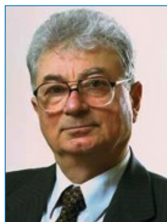
Figura 1. Yuri Ts. Oganessian (1933), director científico del Laboratorio Flerov de Reacciones Nucleares, del JINR en Dubná (Rusia), codescubridor de los últimos 6 elementos superpesados (Z ≥ 113)

se siguen observando en la distribución de los neutrones. Por lo tanto, los números mágicos de N y Z asociadas a los núcleos más estables parecen desaparecer para estos elementos superpesados, siendo probablemente el 208 Pb el último núcleo doblemente mágico [3] (N y Z par).