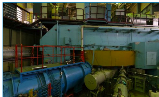
Figura 2. Ciclotrón U400 del JINR donde se aceleraron iones de 48 Ca, isótopo poco abundante del Ca, con energías de 251 MeV. El blanco estaba formado por óxidos de 249 Cf depositados en láminas de Ti de 1,5 μm de espesor [4]

se siguen observando en la distribución de los neutrones. Por lo tanto, los números mágicos de N y Z asociadas a los núcleos más estables parecen desaparecer para estos elementos superpesados, siendo probablemente el 208 Pb el último núcleo doblemente mágico [3] (N y Z par).