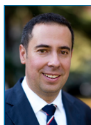
D. Carabantes-Alarcón 3