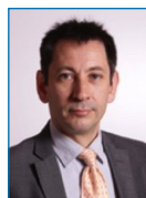
M. Á. Sastre-Castillo 2