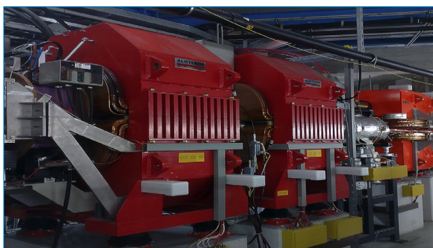
Figura 1. Acelerador de iones pesados de las instalaciones del Gesellschaft für Schwerionenforschung (GSI), Darmstadt, Alemania

Por último, en cuanto a sus usos y aplicaciones se refiere, debido a su alta radioactividad y a su período de desintegración, no se ha encontrado utilidad práctica aún, limitándose su uso a la realización de estudios teóricos físicoquímicos.