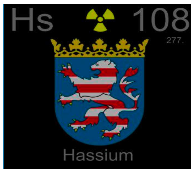
Figura 1. Representación de una casilla de la tabla periódica para el hasio, donde se ha incluido el escudo del estado alemán de Hesse [5]

Entre los datos estimados se pueden citar un radio covalente de 134 pm y una entalpía de fusión de 20,5 kJ/mol 2 . Asimismo, se han estimado valores para las tres primeras energías de ionización.