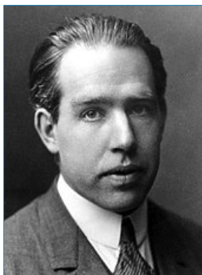
Figura 1. Niels Bohr (1885-1962) ( https://bit.ly/1j5gHly , visitada el 12/03/2019). Científico danés que realizó contribuciones fundamentales para la comprensión de la estructura del átomo y la mecánica cuántica. Fue galardonado con el premio Nobel de Física en 1922

El bohrio es radiactivo, no tiene isótopos estables o naturales, y su isótopo conocido más estable, 270 Bh, tiene una vida media de aproximadamente 61 s, aunque el isótopo 278 Bh podría tener, aún sin confirmar, una vida media de unos 690 s. [3]