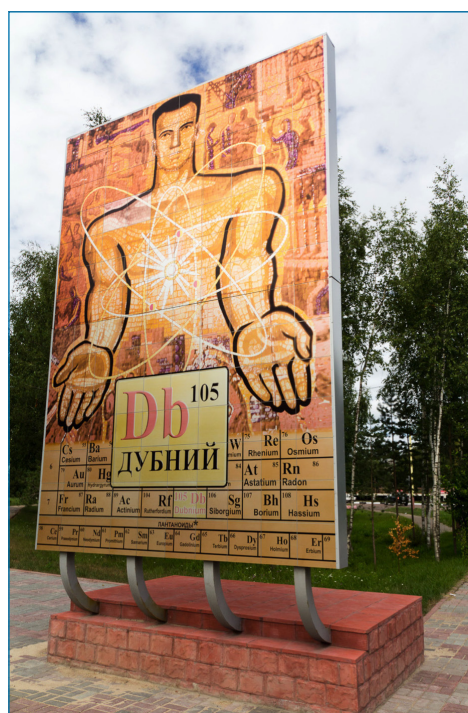
Figura 1. Monumento conmemorativo del descubrimiento del elemento dubnio en la ciudad rusa de Dubná [4]

debido que se obtienen muy pocos núcleos durante su preparación, y su intervalo de estabilidad es corto. No obstante, se ha podido concluir que forma preferentemente especies pentacoordinadas de tipo oxihaluro como [DbOCl 4 ] - y [DbOF 4 ] - , a diferencia del tántalo para el que se observan mayoritariamente especies hexacoordinadas como [TaF 6 ] - .