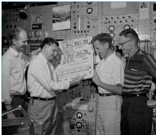
Figura 1. Inscrición del lawrencio en la tabla periódica por A. Ghiorso y colaboradores [1]

Los experimentos llevados a cabo en 1969 con el elemento mostraron que reaccionaba con el Cl 2 (g) para obtener lo que parecía ser LrCl 3 . Estudios posteriores con 260 Lr confirmaron la trivalencia del Lr al comparar el tiempo de