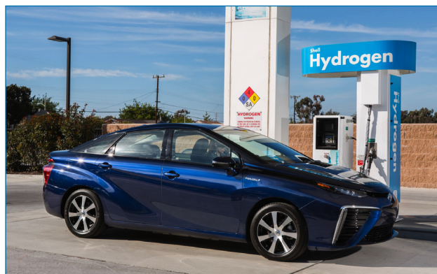
Figura 1. Estación de servicio de hidrógeno (denominada popularmente hidrogenera), junto con un vehículo eléctrico de pila de combustible y depósito de hidrógeno a presión

Se puede obtener tratando con ácidos diluidos, o incluso con agua, diversos metales (como los de los grupos 1 al 4 y lantánidos), usando electricidad mediante electrolisis del agua, mediante energía térmica usando ciclos termoquímicos, mediante energía solar directa produciendo fotólisis de agua, y mediante reformado de biomasa o combustibles fósiles. Este último método ha sido el proceso mayoritario hasta el momento, sobre todo por reformado de gas natural, aunque también se usan productos derivados del petróleo, o carbón.